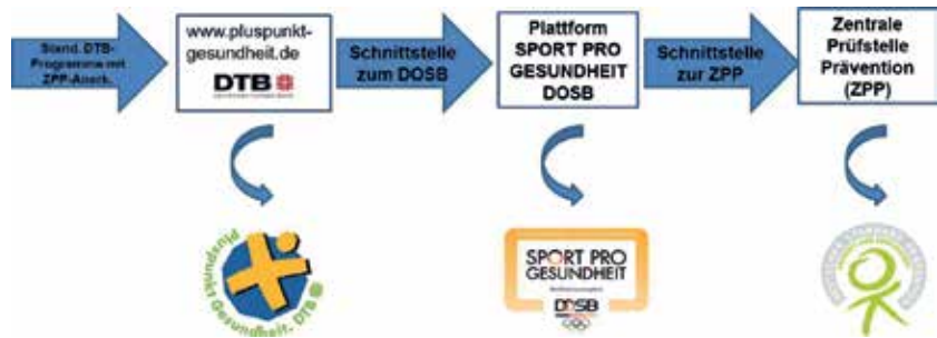
Abb.5: Verfahrensweise der ZPP-Anerkennung für Pluspunkt-Angebote

Die genehmigten Anträge für den Pluspunkt mit ZPP-Anerkennung fließen über eine Schnittstelle in die SPORT PRO GESUNDHEIT DOSB-Serviceplattform und von dort aus wiederum über eine Schnittstelle zur ZPP, wo sie wie alle anderen registrierten Angebote für die Krankenkassen in einer allgemeinen Datenbank abrufbar sind. Es gibt keine gesonderte Datenbank für Qualitätssiegel-Angebote mehr.