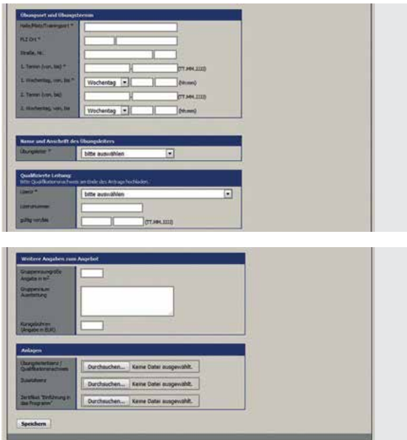
Abb.7: Screenshot Pluspunkt-Anträge 2+3

Bei dem Kursprogramm „CARDIO-AKTIV – Herz-Kreislauf-Training für Jung und Alt“ handelt es sich um ein Einstiegsprogramm, das auf die Verminderung von Bewegungsman-