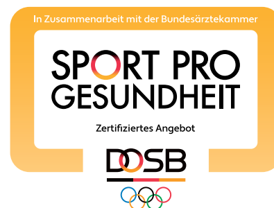
Abb. 2: Qualitätssiegel SPORT PRO GESUNDHEIT

Der Deutsche Sportbund hat im Jahr 2000 gemeinsam mit dem DTB und anderen Spitzenverbänden sowie der Bundesärztekammer eine Dachmarke für Qualitätssiegel im Gesundheitssport eingeführt: SPORT PRO GESUNDHEIT.